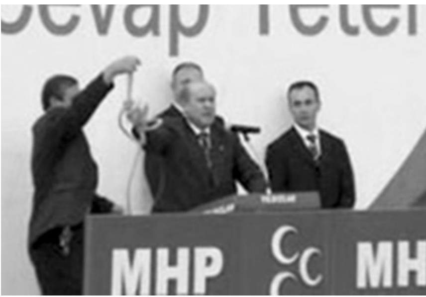
MHP Genel Başkanı Devlet Bahçeli, hükümete yönelik "Öcalan'ı niye asmıyorsunuz, ipiniz mi yok" diye, kürsüden ip fırlattığı, ipe sapa gelmez konuşmasını yaparken.

ABD planı tuttu mu? Tutmadı. Tutmadı zira bir, siyasal iktidarlar Kürt so-